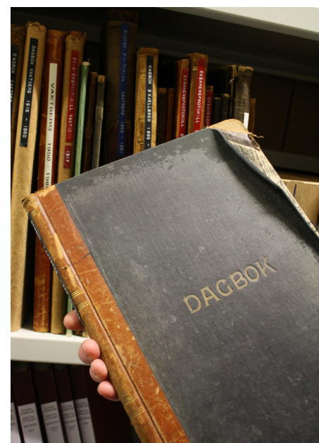
Protokoller fra tidligere Vaktberg skole, Stokke.