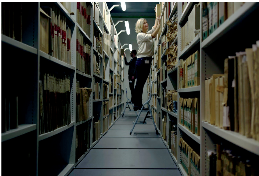
Fra magasin ved IKA Kongsberg.

Grunnskolen er godt representert med allmueskoler/folkeskoler, men det er også arkiver etter framhaldsskole og realskole. Mengden arkiver er avhengig av størrelsen på skolen og graden av bevart materiale. Generelt er det protokoller for fravær