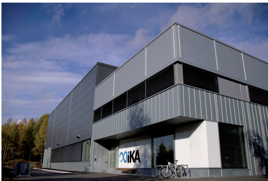
Interkommunalt arkiv for Buskerud, Vestfold og Telemark IKS. Nytt arkivbygg på 3600 kvm åpnet i 2014. Selskapet har 44 eiere.

Kommunale arkiver kan ha en del huller i arkivseriene. Historisk har dette sammenheng med manglende oppmerksomhet, ubetenksom kassasjon eller tilfeldig årsaker. Fordelene ved å samle materiale i et depotarkiv som IKA Kongsberg, er at alle arkivene fra en kommune samles på ett sted, ordnes, sikres og gradvis blir søkbare på den nasjo-