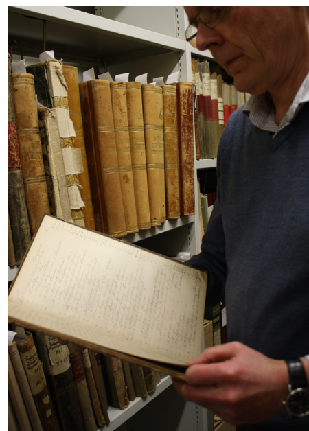
Protokoller fra fattigvesenet, Tønsberg